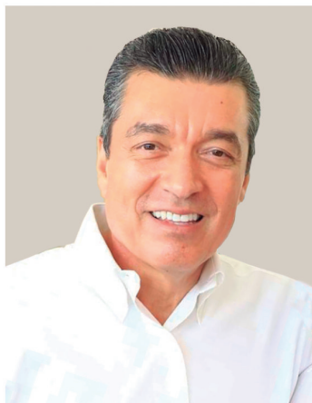
Dr. Rutilio Escandón Cadenas Gobernador Constitucional del Estado de Chiapas